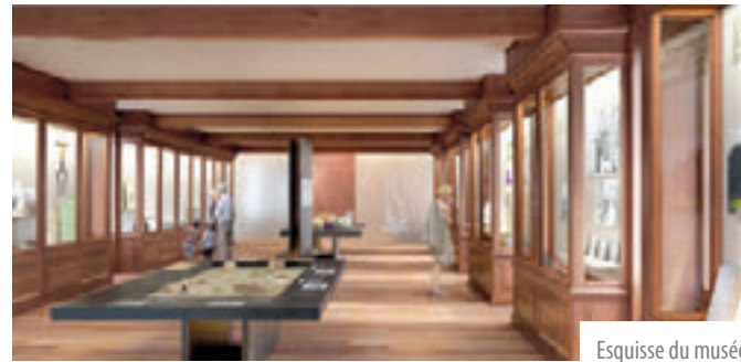
Esquisse du musée

La partie musée proposera une exposition permanente consacrée à l'histoire de Verrières depuis l'époque néolithique jusqu'à nos jours, dans la salle de musée installée par Philippe de Vilmorin en 1905. Les vitrines actuelles en bois et verre seront restaurées pour accueillir