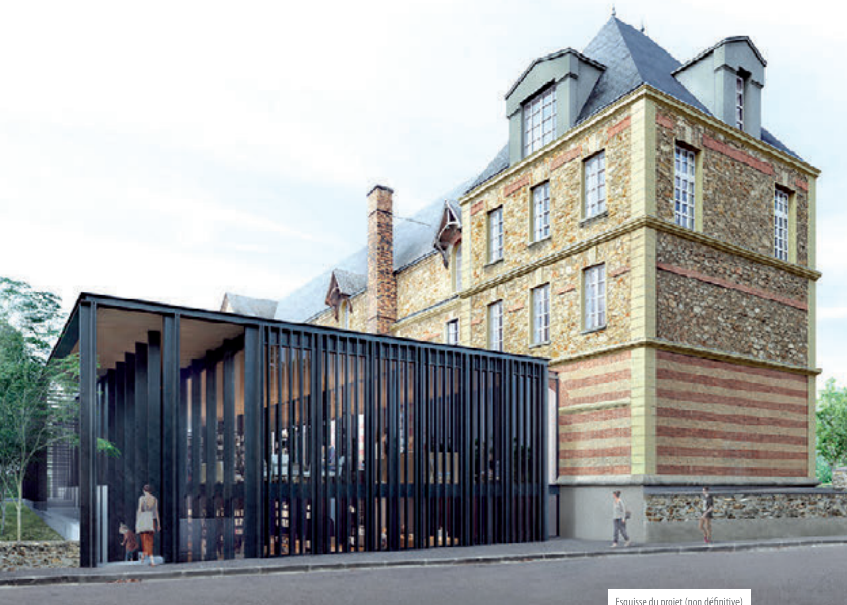
Esquisse du projet (non définitive)

Ils accueilleront des espaces de la médiathèque. Les matériaux choisis pour sa construction s'intégreront parfaitement avec le bâtiment existant. Traitée en structure acier, en rappel à la structure du bâtiment noble, cette partie du bâtiment sera entièrement vitrée côté jardin et côté rue.